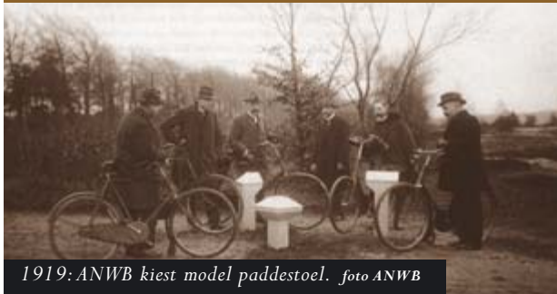
1919: ANWB kiest model paddestoel.

De Rijwielpadenvereniging Gooi- en Eemland werd in 1914 te Baarn door de Algemeene Nederlandsche Wielrijders Bond opgericht e.a. met als doel, in het belang van de fietsers, fietspaden aan te leggen in het Gooi en in Eemland. Aanleiding hiervoor was het toenemende autoverkeer dat "te gevaarlijk voor de andere weggebruikers" werd.